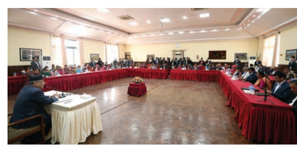
प्रधानमन्त्री पुष्पकमल दाहाल 'प्रचण्ड'सँग शनिवार बालुवाटारमा मिटरब्याज पीडितहरू भेटवार्ता गर्दै ।

शनिवार सरकारबी वार्ता टोली र पीडितहरूको वार्ता टोलीबीच भएको सहमतिमा 'मिटरब्याजहरूले निरक्षर, गरिब तथा आर्थिक रूपले अप्ठ्यारो परिस्थितिमा रहेका व्यक्तिको