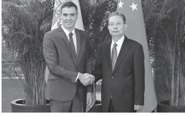
व्यापक रणनीतिक साझेदारीको स्थापनाको २०औं वार्षिकोत्सव मनाइँदै छ। उक्त भेटमा फाओले आपसी विश्वास र मित्रतालाई

यस वर्ष चीन-स्पेन कूटनीतिक सम्बन्ध स्थापना भएको ५० औं वार्षिकोत्सवका साथै चीन-इयु