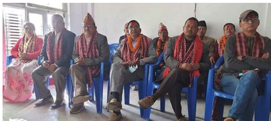
नेपाली काँग्रेस सुदूरपश्चिम कार्य समितिमा नवनिर्वाचित पदाधिकारी एवं सदस्यहरू घनगढीमा प्रमाणपत्र वितरण लिइरहेका।

सत्तारूढ दल नेपाली काँग्रेसको १४औं महाधिवेशन अन्तर्गत ६ प्रदेशमा भएको अधिवेशनमा सभापति एवम् प्रधानमन्त्री शेरबहादुर देउवा पक्षले चार प्रदेशको सभापति जितेको छ। देउवा इतर समूहले भने दुई वटा प्रदेशमा मात्रै जितेको छ।