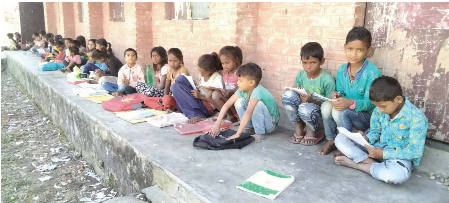
महोत्सवीको मनरासिस्वा नगरपालिका-१० स्थित प्राथमिक विद्यालय मध्यान्हा भवन अभावमा बरगडामा पढ्दै विद्यार्थी।

दक्षिण छिमेक भारतमा शुक्रवार ओमिक्रोनको संक्रमण देखिएको थियो। सोमवार भारतमा ओमिक्रोन पुष्टि हुने संख्या २९ पुगेको छ। सरकारले ओमिक्रोन रोकथाम गर्न दक्षिण अफ्रिका सहित ९ देशबाट नेपाल प्रवेश रोक लगाएको छ। तर नेपालमै ओमिक्रोन पुष्टि भएकाले भिडभाड नगर्न र स्वास्थ्यको मापदण्ड अपनाउन आग्रह स्वास्थ्यमन्त्रालयले आग्रह गरेको छ।