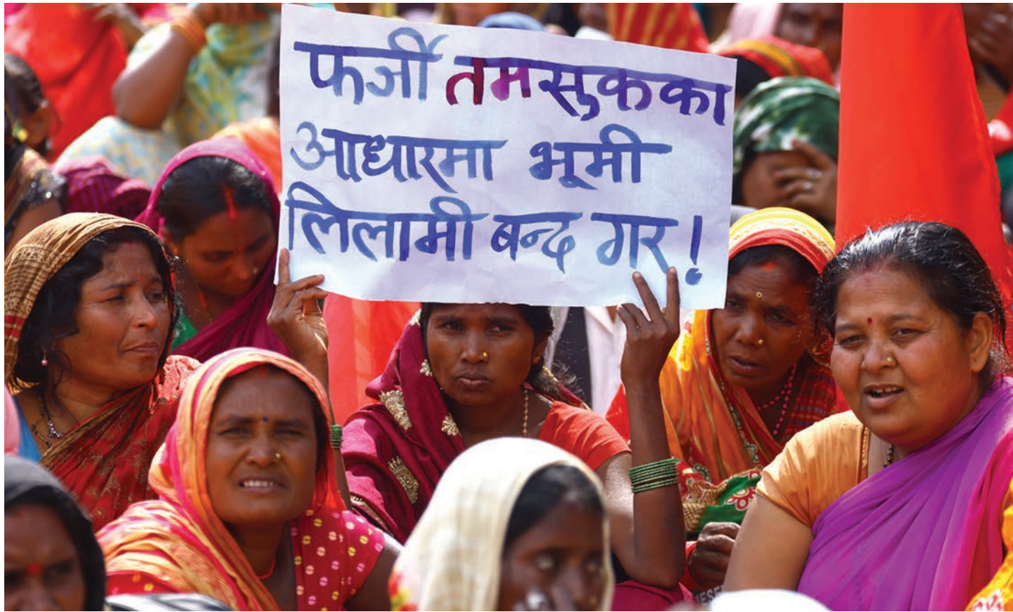
मिटरब्याज पीडितको दोस्रो टोली काठमाडौंमा प्रदर्शन गर्दै ।