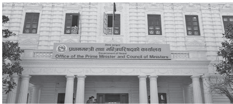
मध्याह्न संवाददाता काठमाडौं, २० चैत

सरकारले गृहमन्त्री र गृहसचिवले गुप्तचर परिचालनका लागि आफूखुसी खर्च गर्न बनेको कार्यविधि खारेज