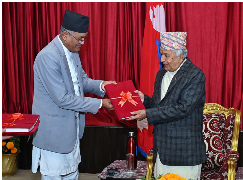
बनाउन र फौजदारी न्याय प्रणालीलाई थप सुदृढ गर्न कार्यालयले विभिन्न नीतिगत सुधार गरेको प्रतिवेदनमा छ।

उक्त आवमा नेपाल सरकारवादी भइ मुद्दा चलाउन गरी निर्णय भएको मुद्दाको संख्या ४४ हजार आठ सय ११ र प्रतिवादी संख्या ६९ हजार छ सय ३५ छ। महान्यायाधिवक्ता कार्यालय र मातहतका कार्यालयहरूसँग ५५ वटा विषयमा कानुनी राय माग भएकामध्ये ४५ वटा विषयमा कानुनी राय सल्लाह उपलब्ध गराइएको जनाइएको छ। अभियोजन प्रक्रियालाई वैज्ञानिक प्रमाणमा आधारित