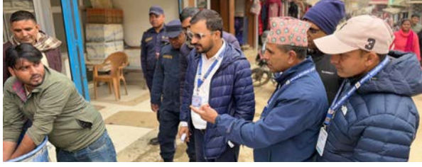
जुम्ला, २८ पुस