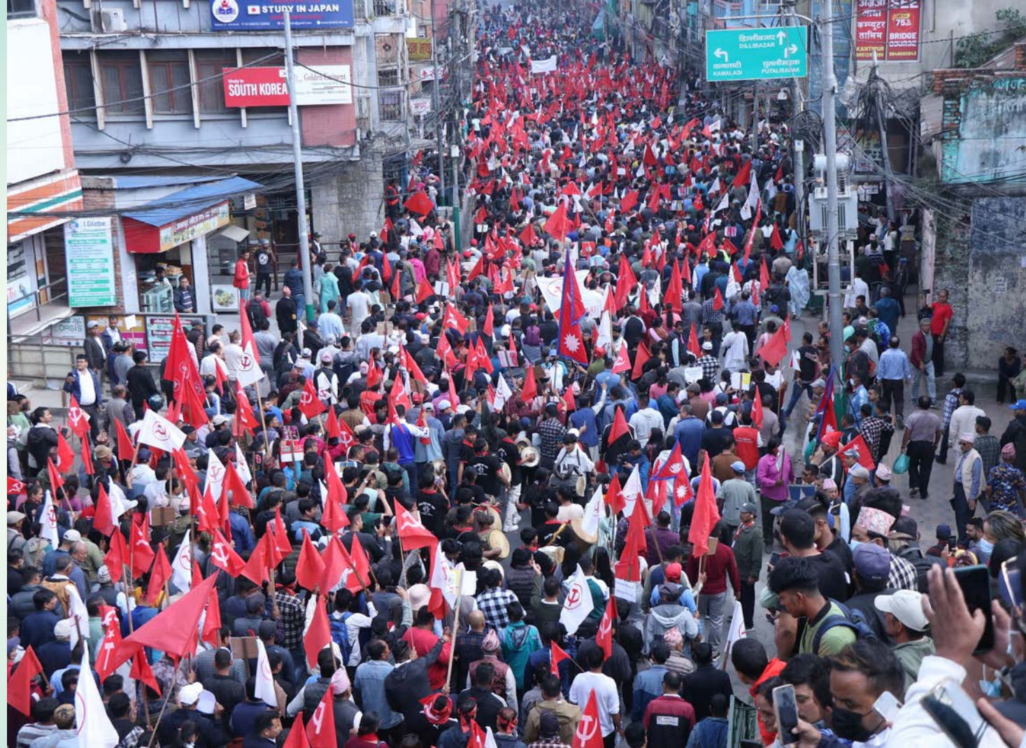
नेकपा माओवादी केन्द्रले शनिवार काठमाडौंमा गरेको खबरदारी सभामा सहभागी नेता/कार्यकर्ता ।

प्रधानमन्त्री ओलीले भनेका छन्, 'नेपालको राजनीतिक, सामाजिक इतिहासमा, परिवर्तनका कुराहरूमा >>> पृष्ठ २ मा