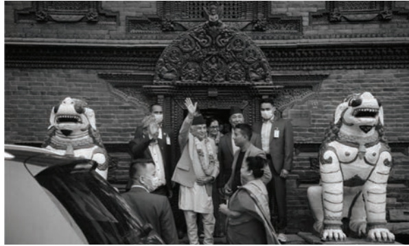
मध्याह्न संवाददाता काठमाडौं, ४ चैत

केही समय अघि निवर्तमान राष्ट्रपति विद्यादेवी भण्डारीको सवारीका बेला सडक खाली गर्ने क्रममा ट्रमा सेन्टरका चिकित्सकमाथि कुटपिट भयो। कर्मचारीको कुटपिटपछि चिकित्सकहरुले आन्दोलन नै गरे। उक्त घटनालाई लिएर