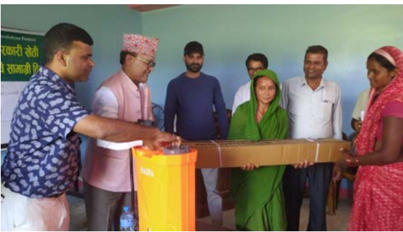
प्रदिप सिंह/मध्यान्ह लहान, ९ कात्तिक

सिंहको लहान नगरपालिका वडा नम्बर १५ का किसानहरूको आय वृद्धि गर्दै जैविक खेतीतर्फ प्रोत्साहन गर्न २ लाख रुपैयाँ बराबरको कृषि सामग्री वितरण गरिएको छ। केयर नेपालको आर्थिक सहयोगमा आयोजित कृषि सामग्री वितरण कार्यक्रममा राष्ट्रिय कृषक समूह महासंघ नेपालको नेतृत्व र सामुदायिक वन उपभोक्ता महासंघको सहकार्य रहेको थियो। सो अवसरमा नमुना कृषक समूह, डिडवार बाबा कृषक समूह र राजदेवी कृषक समूहका ६३ जना किसानहरूलाई विषादीमुक्त