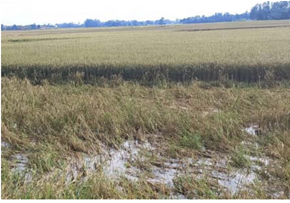
प्रेमचन्द्र भ्वा/मध्यान्ह रौतहट, ९ कात्तिक

बाढी तथा अवरल वर्षाको कारण रौतहटमा दुई अर्ब दश करोड रुपैयाँ बराबरको बालीनालीमा क्षति पुगेको छ। कृषि ज्ञान केन्द्र रौतहटले सार्वजनिक गरेको तथ्यांक अनुसार १७