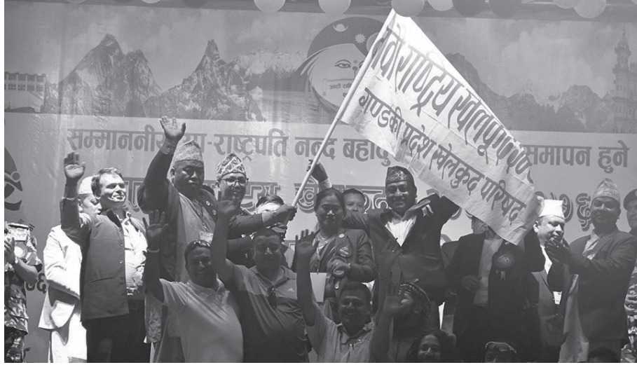
कृष्ण दवाडी/रासस कोशी, १६ जेठ

सरकारले आगामी आर्थिक वर्ष २०७७/०७८ को बजेट वक्तव्यमा नवौं राष्ट्रिय खेलकुद प्रतियोगिताका लागि आवश्यक पूर्वाधार निर्माणमा बजेट विनियोजन गरेको छ।