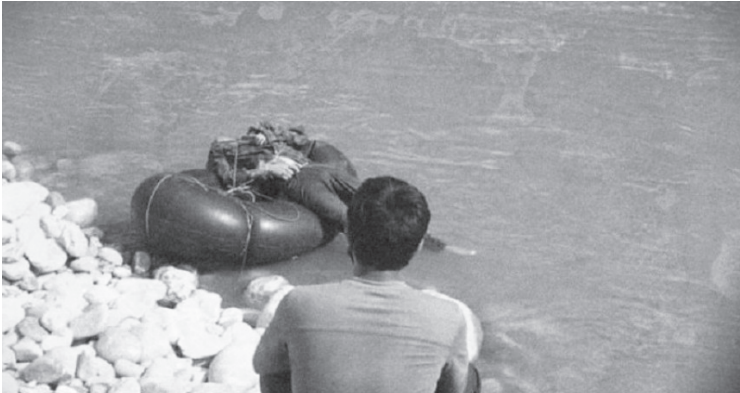
टोली घटनास्थल पुगेको हो।

रुकुम हत्याकाण्डको छानविन गर्न सरकारले गठन गरेको समितिले शुक्रवारबाट स्थलगत अध्ययन शुरू गरेको छ। गृहमन्त्रालयको सहसचिव नेतृत्वको टोली शुक्रवार जाजरकोट पुगेर सोधपुछ शुरू गरेको हो।