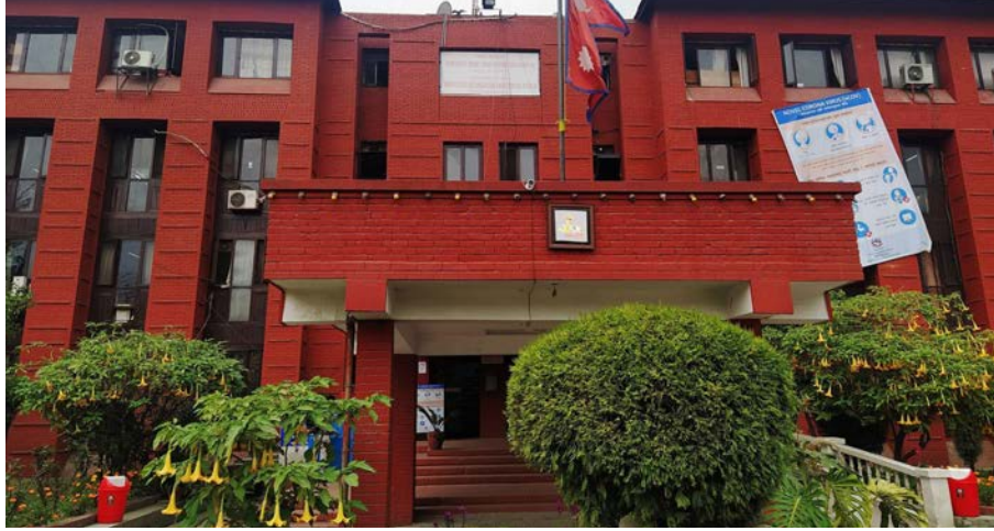
विवरणसमेत खुलाएर सेवाग्राहीलाई जानकारी गराउन मन्त्रालयले

मन्त्रालयले पठाएको पत्रमा शल्यक्रिया शुल्क खुलाउनु पर्ने, सबै खालका शय्याको विवरण, रेडियोलोजी सेवा तथा ल्यावको शुल्क विवरणसमेत खुलाउन भनिएको छ। त्यसैगरी टिकटसहितका अरु सेवाको