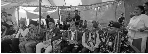
रुकुम पश्चिम, ११ असोज