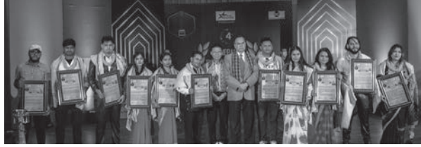
मध्याह्न संवाददाता काठमाडौं, ११ असोज

विभिन्न ४० विधामा अवार्ड प्रदान गर्दै चौथो नेपाल म्युजिक एण्ड फेशन अवार्ड २०८० सम्पन्न भएको छ । विलक्षण क्रियसन प्रा.लि. र स्टारवान इन्टरटेनमेन्ट प्रा.लि.द्वारा काठमाडौंको रिसियन कल्चरमा बुधवार आयोजित अवार्ड वितरण समारोहमा कार्यक्रमका प्रमुख अतिथि पूर्वप्रधानमन्त्री एवम् नेकपा एकीकृत समाजवादीका सम्मानित नेता फलनाथ खनालले विभिन्न श्रेष्ठाहरूलाई सम्मान तथा अवार्ड प्रदान गरे ।