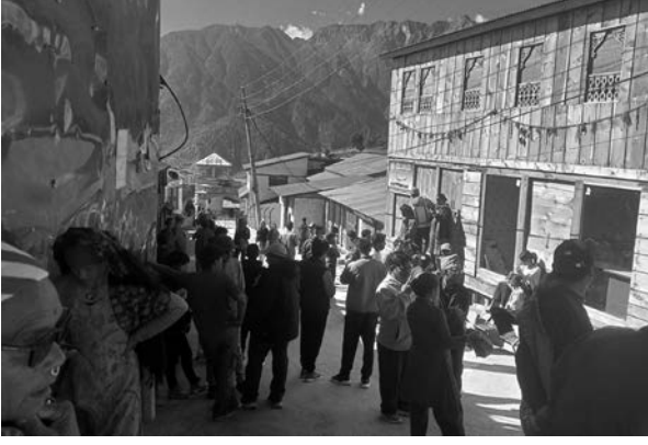
ओवराज शाही/मध्याह्न हुम्ला, ११ असोज

नेपाल सरकारको स्वामित्वमा सञ्चालन हुने नेपाल वायुसेवा निगमको जहाज नेपाल एयरलाइन्सले हुम्ला उडान नगर्दा हुम्लाबासीहरू निजी कम्पनीका जहाजको मुख ताकेर बस्नुपर्ने बाध्यता रहेको छ। राष्ट्रिय सडक नजोडिएको एक मात्र दुर्गम जिल्ला हुम्लामा नेपाल सरकारको स्वामित्वमा सञ्चालन हुने नेपाल वायुसेवा निगमको जहाजले हिमाली जिल्लामा उडान संख्या हप्ताको तीन पटक सेडुल राखेपनि महिनाको तीन पटक पनि उडान गरेको छैन। जसका कारण हुम्लाका नागरिकले जिल्ला बाहिर र जिल्लाभित्र आउन निजी कम्पनीका जहाजलाई हप्ता दिन कुनै पनि बाध्यता रहेको छ। निजी कम्पनीका जहाजहरू डलरमुखी हुँदा जता डलर त्यतै जाने भएकाले हुम्लामा नियमित उडान हुँदैनन्। यदि निजी कम्पनीका जहाजले उडान गर्ने परे जिल्ला बाहिरबाट पर्यटक आउने भएमात्र