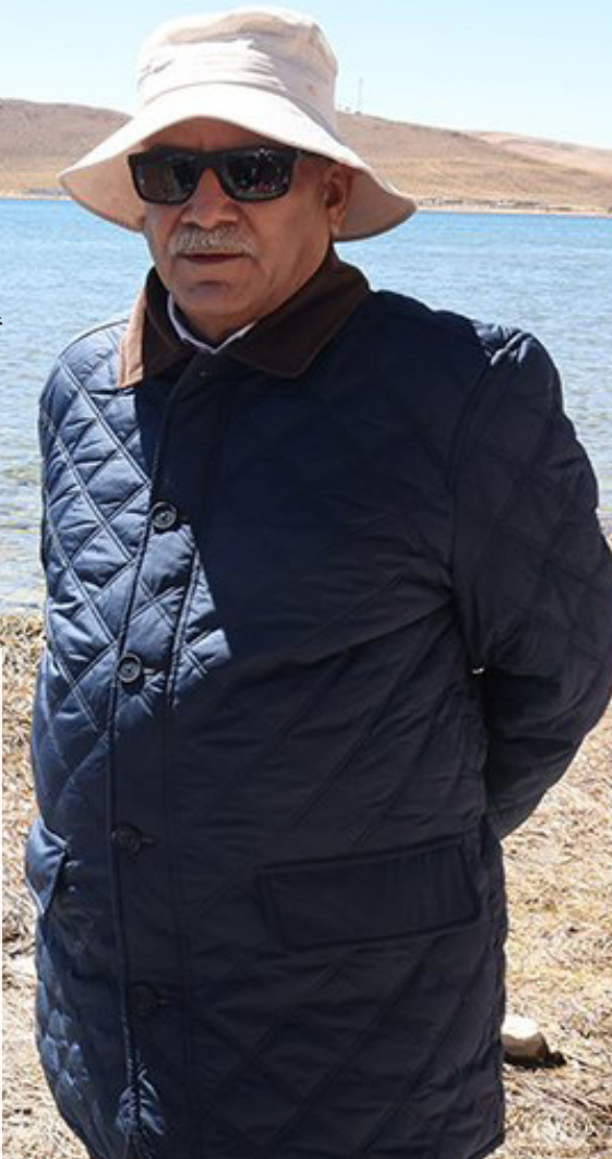
मानसरोवर अगाडि तस्वीर खिचाउँदै प्रधानमन्त्री ।

राजनीतिक दलहरु प्रधानमन्त्री प्रचण्डलाई कुरिरहेका छन् । तर, प्रचण्ड देशमा सब ठिकठाक चलिरहेको बेला जस्तो गरी विभिन्न क्षेत्र, नगर, विश्वविद्यालयको अवलोकन र तीर्थाटनमा छन् ।