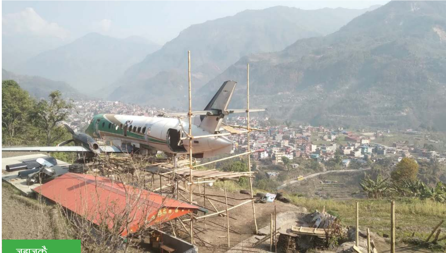
जहाजकै रिपोर्ट निर्माण

काठमाडौंमा फालिएको यति ह्यन्डलाइन्सको जहाज किनेर लामजुङ बैसीसहरको गाउँसहरमा निर्माण गरिदै गरेको प्याराडाइज रिपोर्ट ।